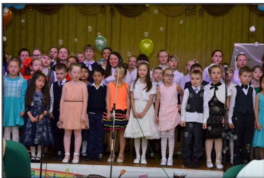
Сводный хор ДШИ им. А. К. Лядова

2) Активная – непосредственное участие в перечисленных школьных культурно-просветительских мероприятиях.